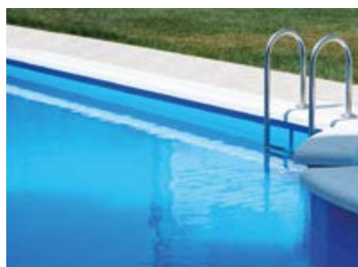
Hormigón y soportes cementosos Concrete and cementitious substrates Béton et supports cimentaires Concreto e suportes cimentícios