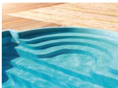
Poliéster y fibra de vidrio Polyester and fibreglass Polyester et fibre de verre Poliéster e fibra de vidro